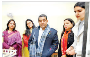
गोहाना। विज्ञान प्रदर्शनी में प्रस्तुत मॉडलों का अवलोकन करते हुए अतिथि प्राध्यापक।