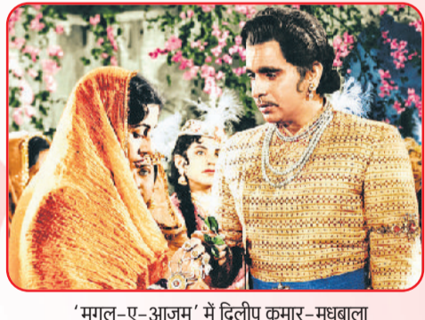
'मुगल-ए-आजम' में दिलीप कुमार-मधुबाला

में बनी फिल्म सम्राट 'चंद्रगुप्त' में भी भारत भूषण और निरूपा राय की जोड़ी थी। सन 1946 में पृथ्वीराज कपूर और मीना कुमारी अभिनीत फिल्म 'पृथ्वीराज संयोगिता' बनी थी। जो इनके प्रेम पर आधारित थी। वर्ष 2022 में यशराज फिल्मस ने अक्षय कुमार-मानुषी छिल्लर अभिनीत फिल्म 'सम्राट पृथ्वीराज' का निर्माण किया था। रजिया सुल्तान और याकूत की प्रेम