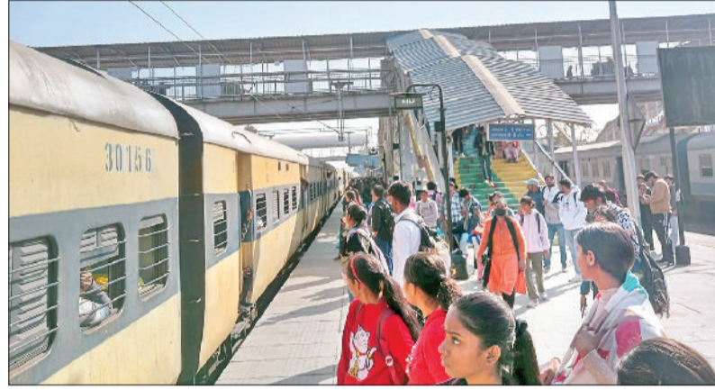
सोनीपत। स्टेशन पर ट्रेन में सवार होने के लिए प्लेटफार्म दो पर खड़े यात्री।

आरपीएफ ने चेन पुलिंग के आरोप में 136 लोगों को गिरफ्तार कर न्यायालय में पेश किया, जहां आरोपियों से कुल 58500 रुपये जुर्माना वसूलकर छोड़ा गया। वहीं आरपीएफ शेष 151 लोगों की तलाश में जुटी है, ताकि ट्रेनों में हो रही चेन पुलिंग की घटनाओं पर लगाम लगाई जा सके। इसके लिए समय-समय पर जागरूकता अभियान चलाकर लोगों को जागरूक भी किया जा रहा है।