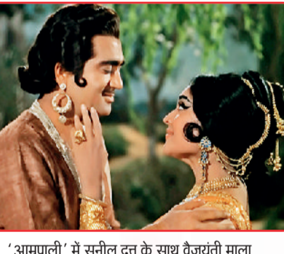
'आम्रपाली' में सुनील दत्त के साथ वैजयंती माला