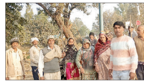
सोनीपत। गांव बड़वासनी में बंदरों के आतंक के चलते डंडों के साथ मोर्चा संभाले ग्रामीण।